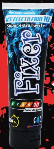
EFECTO ICE 012411.003 Tubo 170gr (1x12)