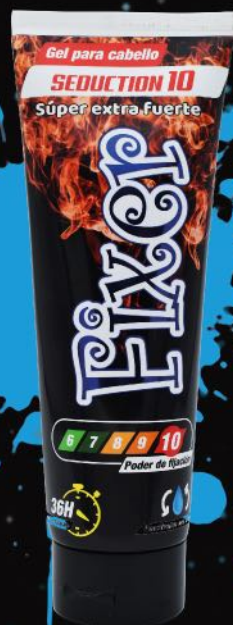
SEDUCTION 012411.003 Tubo 170gr (1x12)