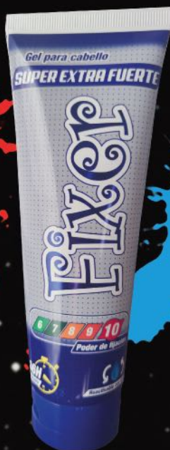
SUPER EXTRA FUERTE 012412.004 Tubo 170gr (1x12)