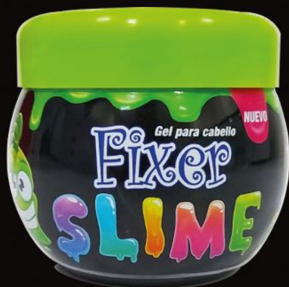
EFECTO ICE 012413.001 Envase (6x340)